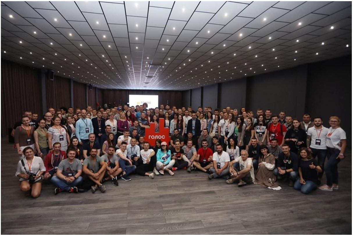
Святослав Вакарчук і Юлія Починук у штабі партії «Голос», 2019