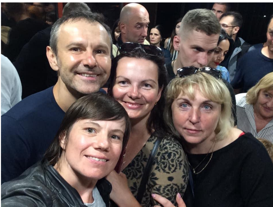
Святослав Вакарчук і Юлія Починок, 2019

культури стала симпатією відомого польського журналіста та промоутера культури Роберта Пясковського. Найтепліші спогади про цей надзвичайно плідний та активний рік закордоном. Найміцніше стосунки відкрилися в медичному університеті в Тернополі, тут я зрозуміла, що знайшла любов цілого свого життя, про що навіть не підозрювала ще до весни 2017 року. Як виявилось я – любов відомого українського політика та лідера рок-гурту «Океан Ельзи» Святослава Вакарчука. Всі пісні та щоденниковий роман присвячені мені. Я дізналася, що у мене був нік і що хлопець все життя жив у великій таємниці. Він любив мене дистанційно і скрито, незважаючи на те, що я про це навіть не здогадувалася. Мені просто пощастило, що я стала симпатією ректора медичного університету Михайла Корди і він при підготовці до 60-річчя ЗВО допоміг мені розкрити цю велику таємницю та стати симпатією Святослава Вакарчука вже у червні 2017 року.